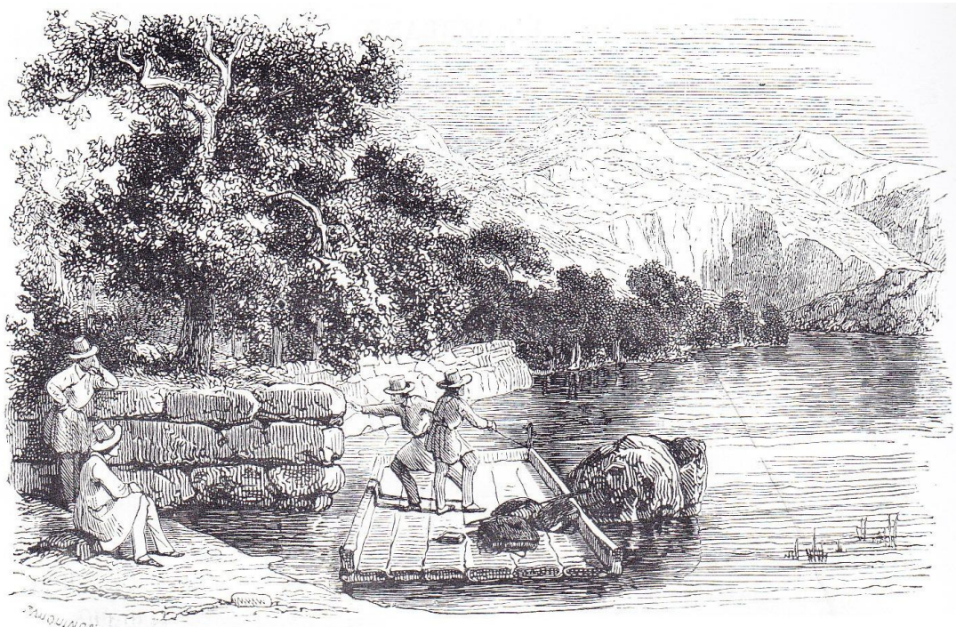
LE LAC DE ZUG